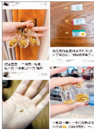
网友在社交平台分享攒金豆的过程。

倾向于购买轻克重产品，并且按克重计价产品销量的增幅显著高于按件计价产品，实物黄金投资消费继续较快增长。