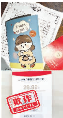
骗子在群内发红包，给受骗者一些甜头。