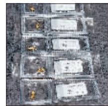
黄金饰品店推出的“金豆豆”产品。

3. 投资一定要买自己了解的产品，现在年轻人投资容易有“羊群效应”，大家买什么就跟着去买什么，这不可取，投资理财要选择适合自己的方式。