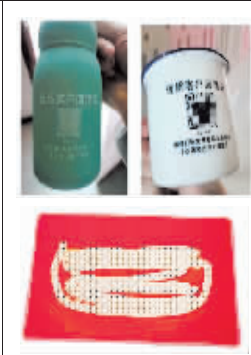
快递盒子内的杯子和二维码卡片。

微信团队提醒大家，这其实是新型诈骗。诈骗分子用邮寄的方式广撒网，只要你扫描了杯子上的二维码，“杯具”的故事就开始上演了。