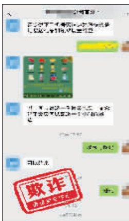
骗子还会冒充电商平台客服送一些用品。