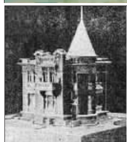
位于建设街的小洋楼及模型图片。

1983年吕惠连决定移居澳大利亚,居住在悉尼市的一所老年公寓。2010年4月8日,吕惠连在澳大利亚走完人生最后的旅程,在老年公寓里安详离世,享年96岁。