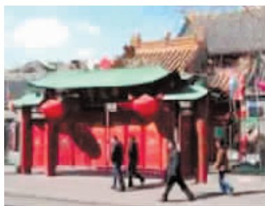
寺现状。吕泰出资建造的华严

精准、故事情节丰富、可读性强等。3. 稿件请发送至22304430@qq.com,同时请注明姓名、个人简介(100字以内)、联系方式。