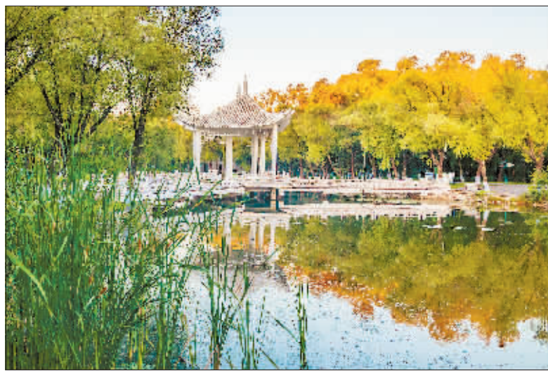
摄影《浅秋》 作者 门奎