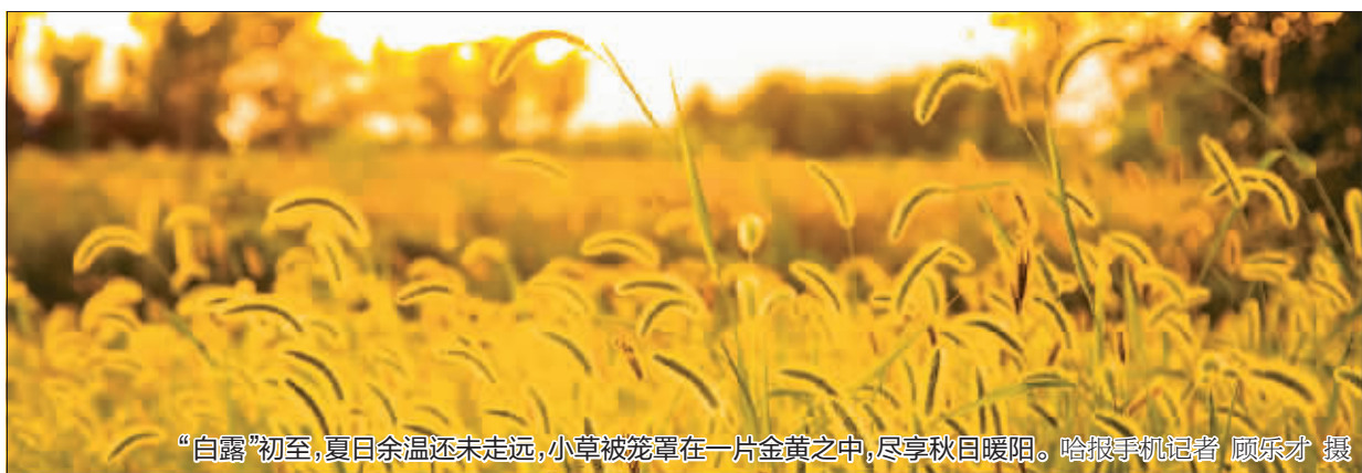
“白露”初至,夏日余温还未走远,小草被笼罩在一片金黄之中,尽享秋日暖阳。哈报手机记者 顾乐才 摄

新区公交公司对“敬老专线”的公交车长进行了专项培训,提出服务老年乘客时要做到上车不催促、唠叨不在意、帮助不迟疑、措施不松劲,并积极倡导乘客关心和帮助老年乘客,营造良好社会氛围。同时,还开展了医疗知识培训。