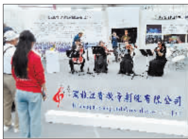
文化演出单位展区吸引观众驻足欣赏。