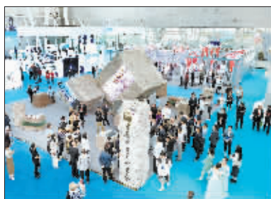
展厅正中镶嵌着大型屏幕的巨石引来参观者拍照打卡。