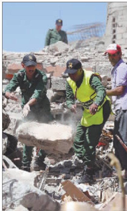
9月11日,救援人员在废墟上搜救。

布希巴说,这次地震震中位于山区,海拔高,山区内村庄人口密度高,再加上天气影响,给救援工作造成较大困难。