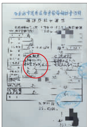
“结婚登记申请书”上面的单位是原市厨房设备制造厂(红圈处)。