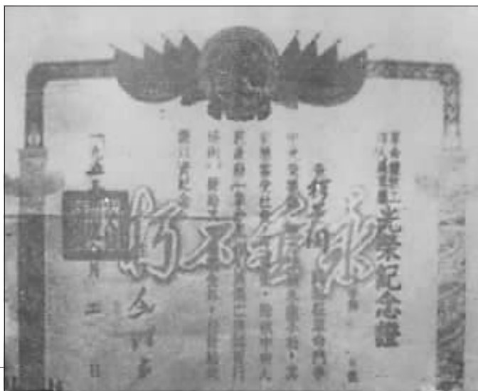
穆景周牺牲光荣纪念证。