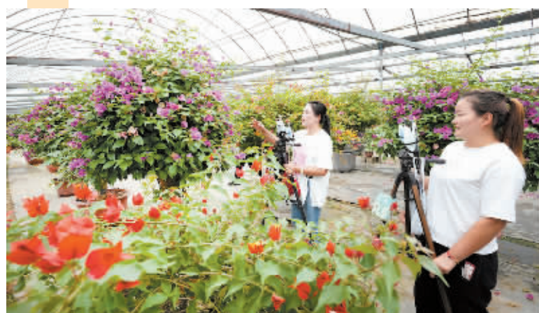
沭阳国际花木城内,带货主播在“花海”中直播销售盆景精品。