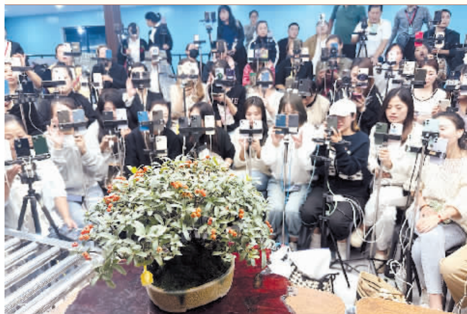
手机是新农具,直播是新农活,扎下镇村民通过矩阵直播销售花木。

扎下镇是“中国花谷”沭阳30个乡镇中的一个。如今的沭阳城乡,随处可见网络直播的场景,手机成为新农具,直播成为新农活,数据成为新农资,网红成为新农民,花乡沭阳正借助互联网实现高质量发展弯道超车,连续三年跻身“千亿俱乐部”。全国经济百强县沭阳致力于打造“中国花谷”,探索花木产业转型,拥有各类盆景1000余万盆,年成交额达40亿元;拥有花木匠师5000余人,集聚淘宝、京东60%的花木类卖家;2023年1月至8月,网络销售零售额为225亿元,花卉直播销售额占全国三分之一。