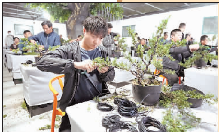
村民利用晚上时间参加盆景制作培训。