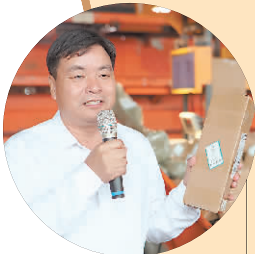
沭阳县政府给售出的苗木快递包装打上“诚信标签”,供客户维权。