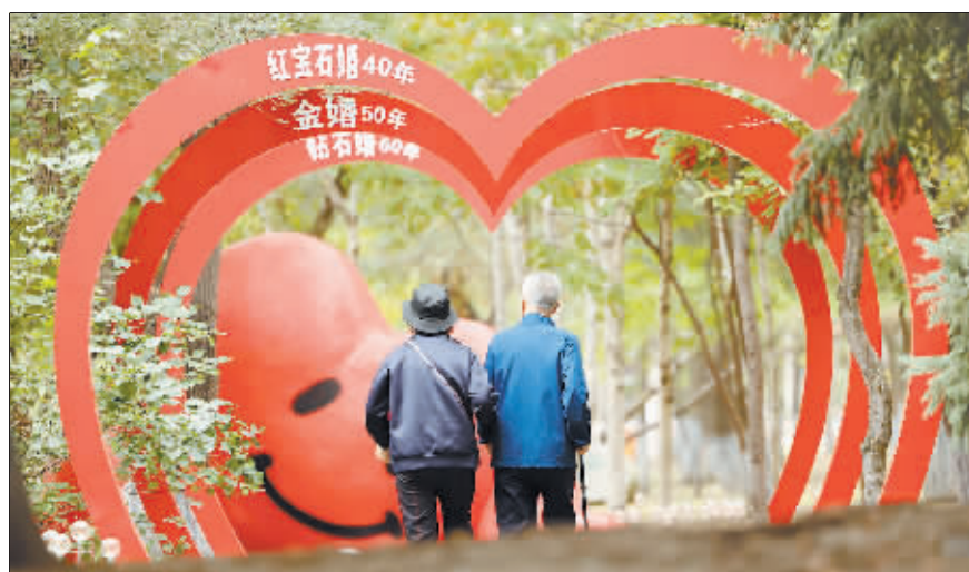
摄影《相伴》 作者 汪琪

秋季是蟹爪兰茁壮成长的季节,此时蟹爪兰的叶片开始迅速生长。因此,养蟹爪兰的朋友们一定要抓住这个时机,如果想让蟹爪兰茁壮成长、叶片硬挺,不妨学学以下方法。