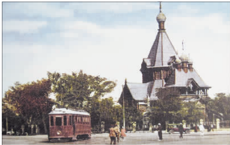
20世纪50年代的圣尼古拉教堂。