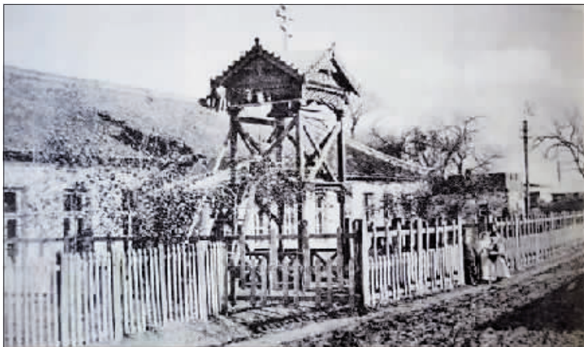
19世纪末,地处田家烧锅(现香坊)的东正教堂。