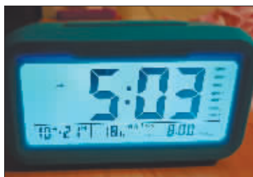
小区居民家的室温。

在反映供暖问题时，请详细准确地提供具体地址、供热企业名称以及自己的联系方式等，以便记者实地走访与核实，及时向供热单位了解情况。