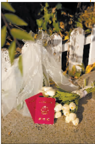
“土豆姐”夫妇这次是回哈尔滨结婚。

视频发布不到24小时播放量近千万，冲上本地热榜。评论区宛如段子大赛，网友们纷纷调侃，“被‘土豆姐’吐槽式安利拿捏了正要去呢，‘宝藏城市’被你发现了，再说话都订不上了”。