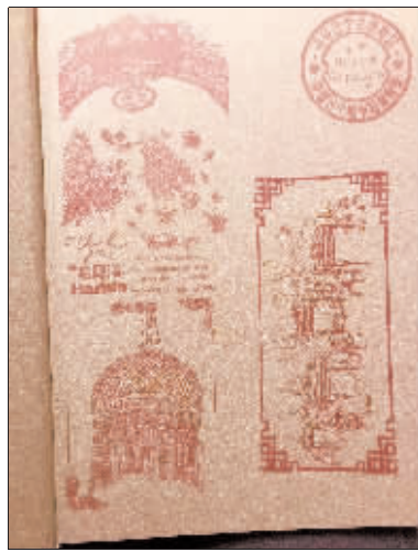
精美的哈尔滨文化纪念章。

作为哈尔滨媳妇，能为“婆家”做宣传她非常骄傲。截至记者发稿时相关视频播放量近1500万，获赞52.4万，评论超16万条，持续霸占同城热榜，“哈尔滨是个有贵族气质的浪漫城市，你可千万别再低调了！”她说。