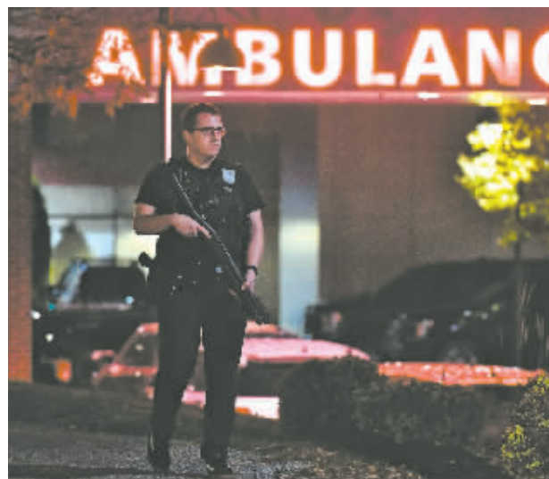
警察在缅因州刘易斯顿一家医学中心外警戒。