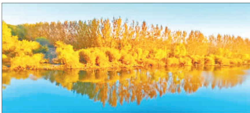
摄影《秋意浓》 作者 陶滨