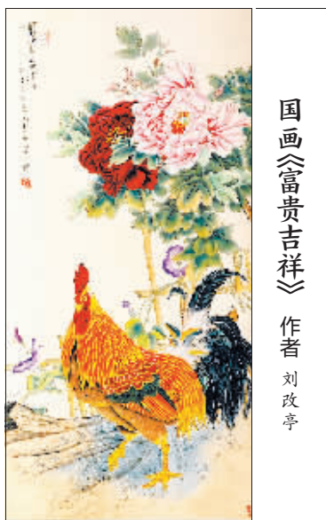
国画《富贵吉祥》 作者 刘改亭