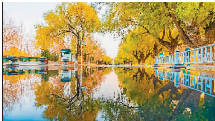
摄影《镜中秋》 作者 张本盛