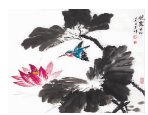
国画《晓露》 作者 洪来祥