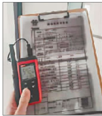
401室测温21.6℃,温度已达标。

4日上午,祥泰人家小区供暖单位金山堡供热公司第四运营部的工作人员为该栋楼更换了一台屏蔽式水泵。供热公司负责人介绍,需要更换安装的屏蔽式水泵3日晚送到了小区,由于安装尺寸和以前的循环泵有所不同,需要准备一下配件。4日8时许,在确保施工安全的前提下,维修站组长和2名焊工师傅把“嗡嗡”响的循环泵拆卸后,将新的屏蔽式水泵进行对接、施焊。经过2个多小时的抢修,10时30分左右,新的屏蔽泵已更换完毕。“之前反映