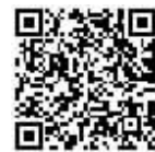
扫码查 事故易发路段