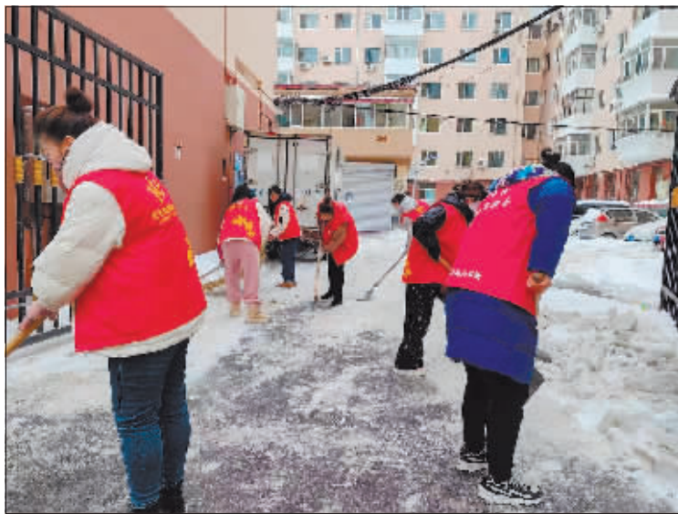
志愿者积极加入清冰雪行动中。

7日,市城管办联合市文明办、市清雪办、市城管局再次向全市临街商家业户、单位发出倡议,请广大临街商家业户“自扫门前雪”,争做“城市主人翁”。请广大临街商家业户和单位,以雪为令,积极行动起来,全市广大临街商家业户和单位积极响应,纷纷开始自扫门前雪,加入到清冰雪大军的队伍中。