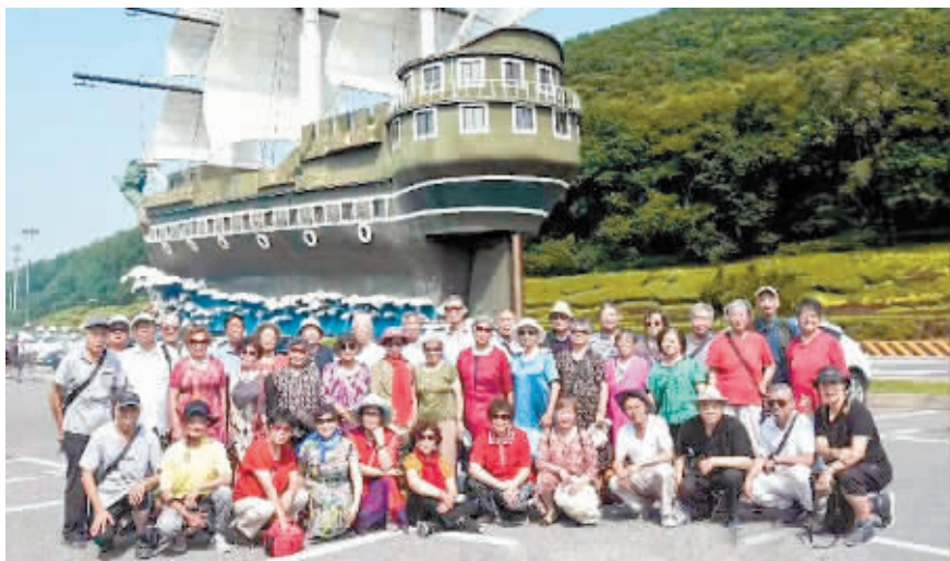
老人们在大连景区合影。