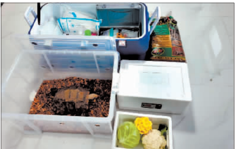
出发前，工作人员为凹甲陆龟准备的急救箱、食物和恒温箱等。

红河州林草局表示，下一步将通过隔离检疫、野化训练等方法，帮助凹甲陆龟恢复野外生存环境，并按照有关规定，在适宜的季节将凹甲陆龟及时放归云南大围山国家级自然保护区。