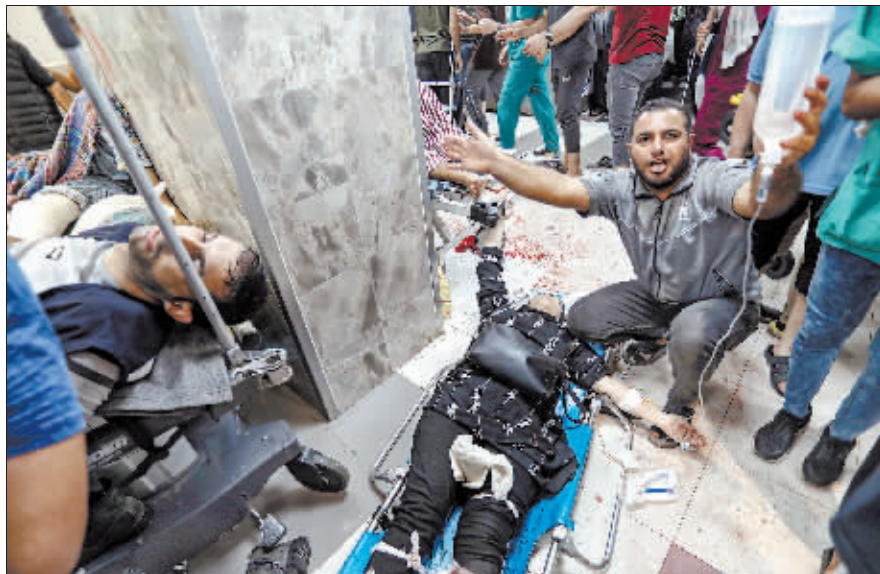
在希法医院门口,伤者等待救治。

巴勒斯坦伊斯兰抵抗运动(哈马斯)媒体办公室19日发表声明说,新一轮巴以冲突爆发以来,以色列军队对加沙地带的袭击已造成超过1.3万人死亡、3万余人受