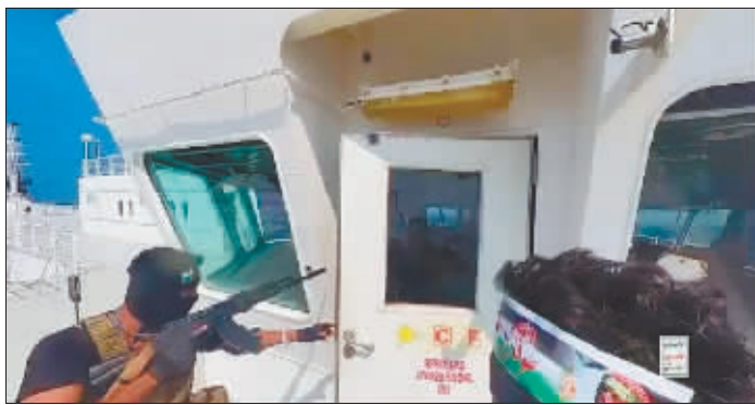
也门胡塞武装公布的扣押船只画面。

数据，被扣留的“银河领袖”号货船从土耳其启程，前往印度比巴瓦沃，在沙特阿拉伯港口城市吉达附近红海水域航行“超过一天”。英国海上贸易行动办公室说，扣船地点距离也门荷台达港大约150公里，靠近东非国家厄立特里亚。