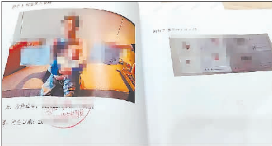
中介提供的虚假亲子鉴定报告。

事件期间，他曾与多个中介保持联系。其中深圳一名中介自称做亲子鉴定业务，可以通过调包样本的手段拿到虚假亲子鉴定结论，以此为“抱养”的婴儿办理出生证明，帮助完成户籍登记。