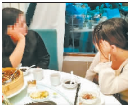
自称可以伪造亲子鉴定的中介人员。