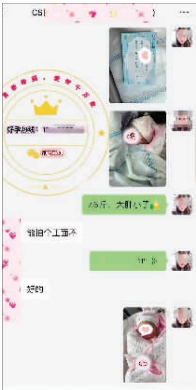
中介人员发来的案例信息。