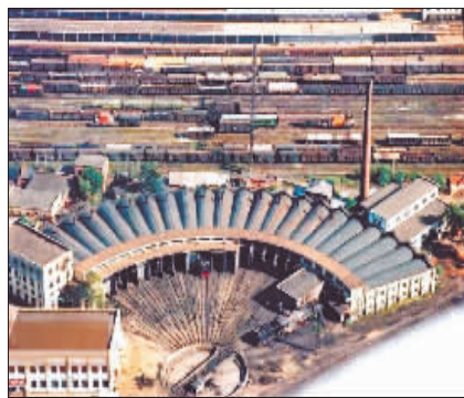
▲原哈机机车库。