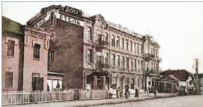
昔日格兰德旅馆大楼。