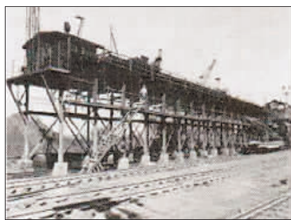
▲原哈机整备线煤台。

哈站大门的变迁，是哈尔滨火车站乃至城市变迁的一部分。时代在前进，现已消失殆尽的“通勤口”、百年货场和百年机务段等站段大门，遂成为哈尔滨的城市记忆。