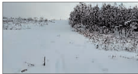
气垫四季大跳台拟在这里建设。

从冬季项目到四季训练,从一家雪场到多家雪场,从专业训练到游客旅游,阿城区利用众多林区山脉资源,深度挖掘百年冰雪文脉留下的更多冰雪文旅资源。其中,百年冰雪穿越便是其中一项。阿城区位于张广才岭余脉,山地较多,多年吸引哈市、大庆等地登山爱好者自发地在冬季雪上穿越。除此以外,