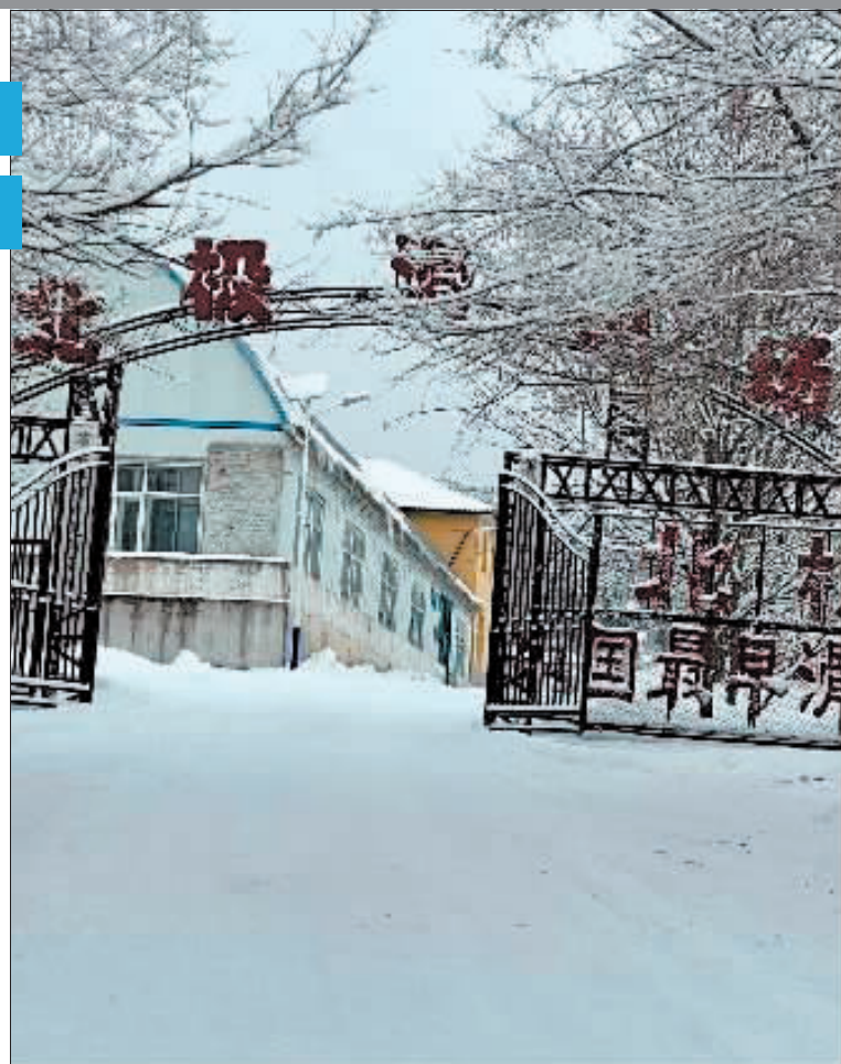
北极滑雪场是中国最早滑雪场。