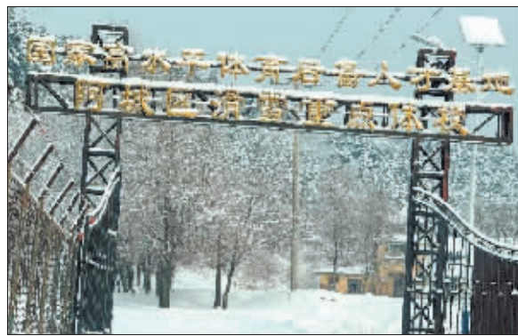
雪场作为冰雪运动基地,培养了很多的冰雪运动人才。