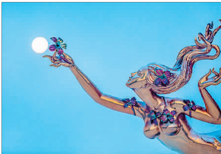
摄影《飞天》作者 门奎