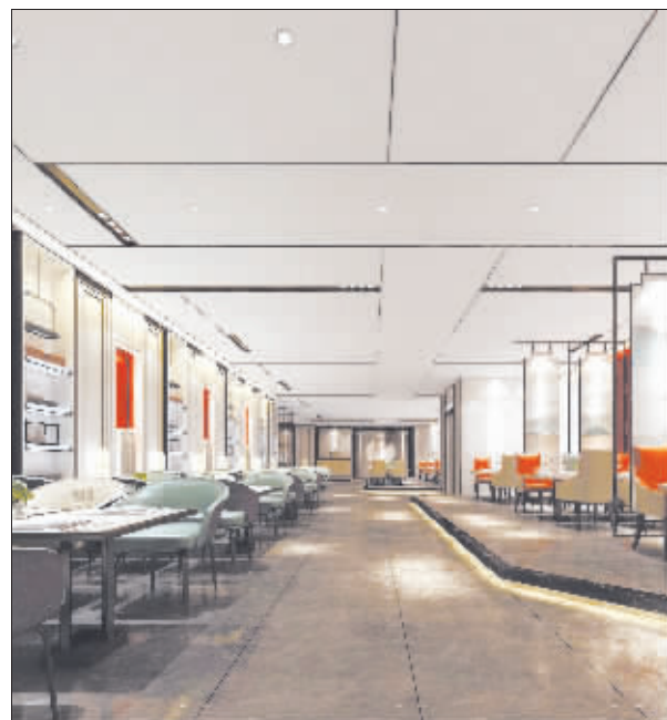
澜悦汇·养生沐浴酒店