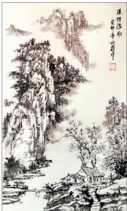
国画《溪径浮动》 作者 应文绍