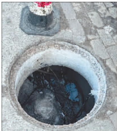
群力第五大道与崂山路交口附近一线缆井井盖丢失。

18日,排水集团工作人员与记者取得联系表示,群力第五大道与崂山路交口处的是一个线缆井,归属于通讯公司,但为了保证市民出行安全,工作人员暂时在井口处放置了路锥,后续会转接到通讯公司派人来维修。当日,民生尚都祥园小区物业站工作人员也打来电话表示,民生尚都公交枢纽站附近与地面分离的井盖目前已维修完毕。