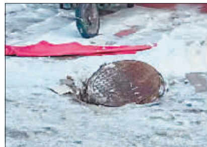
附近另一井盖已悬空。