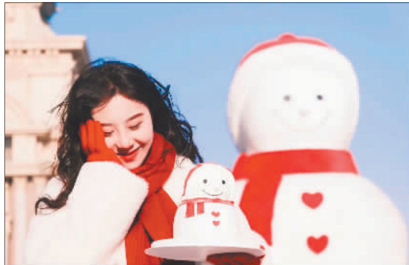
游客手捧雪人蛋糕和大雪人合影。

在哈市倾力打造“创意设计之都”背景下，创意融合文旅成为新的文旅消费亮点。类似雪人蛋糕这种在文旅市场中衍生出的创意产品让许多传统景点焕发了新的生机活力，甚至实现破圈传播再次迎来“高光时刻”。中央大街的黄桃罐头和烤烧饼图案的冰箱贴、哈工大中心的校史背包、烟囱面包和网红完达山冰激凌、中央大街邮局的地标建筑印章……这届游客比以往任何时候都乐于主动探索，这些别出心裁的“脑洞”商品总能带来“自来水”的流量。