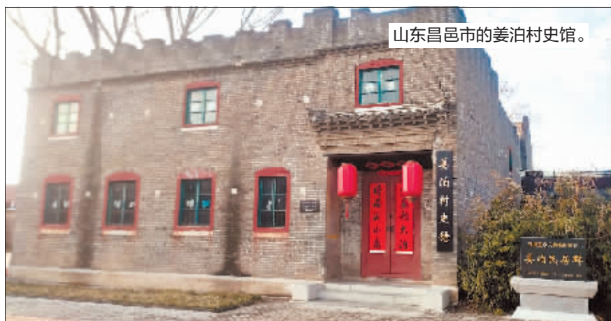
山东昌邑市的姜泊村史馆。

百年前，哈尔滨金融业十分发达，中外银行、钱庄林立。在外国金融势力的挤压下，民族金融资本仍然占有一席之地。比如，山东潍坊人在哈尔滨道外创办的功成玉钱庄，后来，几经坚持，成为私营功成银行。