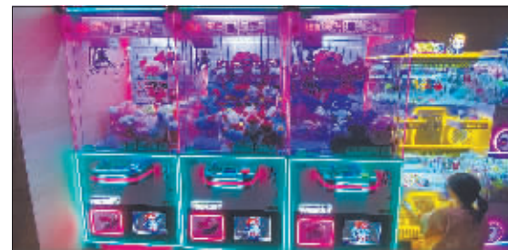
大厅里还设置了游乐设施。

从升级服务到提高核心竞争力，今冬哈尔滨规模较大的洗浴中心纷纷出招儿揽客，洗浴这项传统服务也向人们展示着其焕发的新生机，愈发年轻的消费客群、游客一站式服务体验、越来越广泛的消费认同，都在助力冰城洗浴中心稳定经营。有南方消费者在接受采访时表示，也期待哈尔滨的商家能够提供更多又好又省的潮流洗浴服务，明年一定再来。