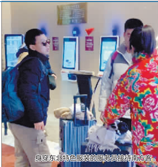
身穿东北特色服装的服务员接待南方客。