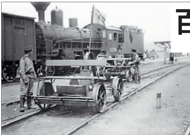
中东铁路时期使用的手摇轨道工作车。