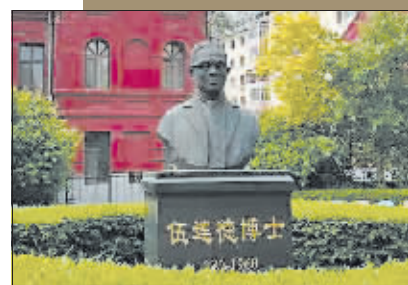
保障街上的伍连德纪念馆。

1928年同记工厂扩建成四层新厂房,年产值150万元以上,拥有各种机械设备700余台套,成为哈埠最大的工厂。随着