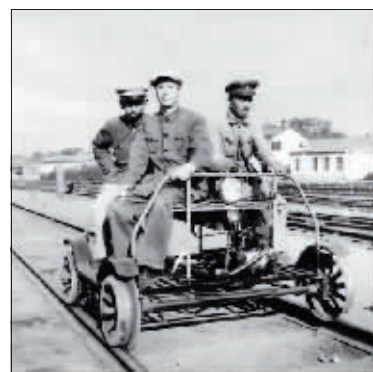
20世纪50年代初期,哈尔滨铁路局使用的轻型轨道车。

1937年卢沟桥事变后,处于日本关东军控制下的满铁开始为日军大举入侵华北提供庞大的运输保障。从此,日本侵略者利用铁道线更加肆无忌惮地对铁路沿线进行疯狂扫荡。除利用铁路机车外,还使用专