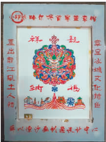
“祥龙纳福”印章爆火。

想得到一款这样的卡片，共需要加盖6枚印章，可谓仪式感满满。“第一枚紫色，代表东方小巴黎的神奇与浪漫，第二枚宝蓝色，代表家乡独有的冰雪资源……”现