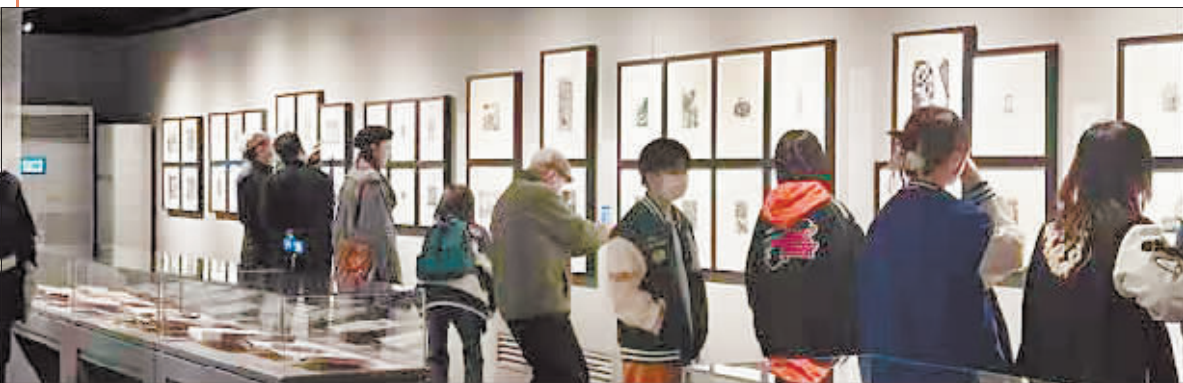
黑龙江(国际)版画馆吸引了各个国家和年龄段的参观者。

在这里,游客和市民大饱眼福的同时,文创产业中心也将开发小版画等伴手礼,把版画艺术带回家。