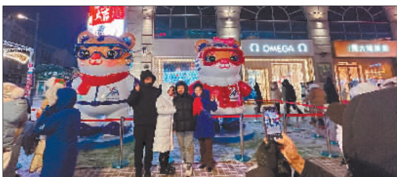
和“尔滨”妮妮“合个影”。