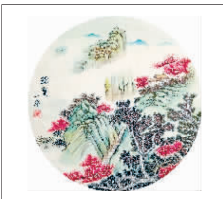
国画《锦春》作者 吴一平