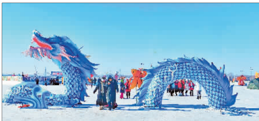
摄影《龙腾盛世》作者 陶滨