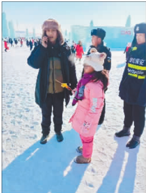
队员帮孩子找家长。

“1月1日接到邀请,就紧急动员、组织人力,3日起展开工作,每天去园区30人左右,白天协助景区管理,晚上帮忙浇冰场。”市政二公司相关负责人说,他们几年前就曾参与冰雪大世界基础设施建设,现在以别样的身份回到熟悉的地方展开了另外一种服务,“作为参与服务‘且’的成员特别高兴,在园区,我们‘文’能帮游客看娃,‘武’能浇冰场、清淘污水井……”