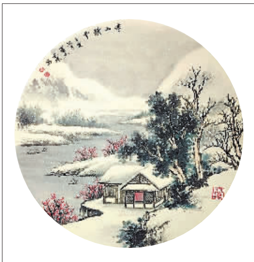
国画《寒山积雪》作者 葛文杰