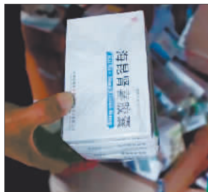
被开出的医保药海昆肾喜胶囊。