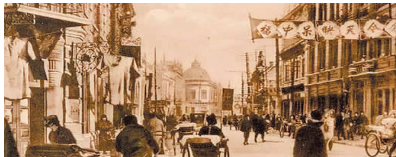
◀20世纪20年代末正阳头道街，左侧为聚隆合百货店。