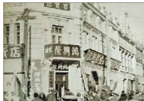
▲20世纪30年代鸿兴隆旧影。