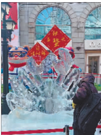
只展出13天的帝王蟹冰雕。