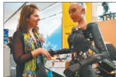
在瑞士“人工智能峰会”上,仿真机器人索菲亚与参会者互动。

不过,OpenAI承认,即便进行了广泛的研究和测试,“我们无法预测人们使用我们技术的所有有益方式和滥用我们技术的所有方式”。综合新华社、中央电视台报道