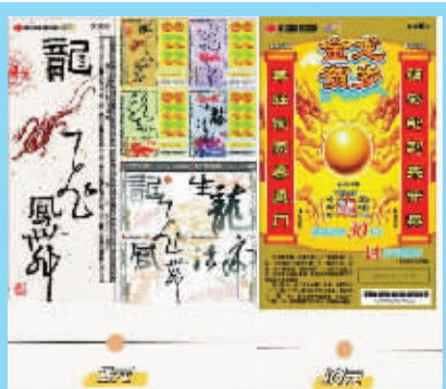
2011年、2012年推出的福彩“龙票”。