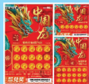
2019年推出的福彩“龙票”“中国龙”系列。