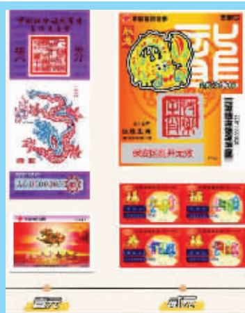
1988年、2000年、2003年、2006年推出的福彩“龙票”。

中国福利彩票随市场变迁,随时代进步,不断提高自身吸引力和参与度,更好地满足人民群众的娱乐、休闲和公益需求。