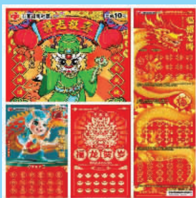
2024年推出的福彩“龙票”“甲辰龙”系列生肖票。