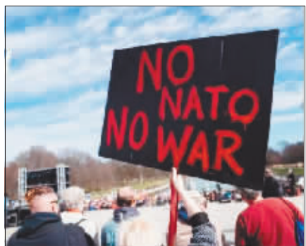
在美国首都华盛顿，一名抗议者手举标语要求美国停止煽动俄乌冲突。

乌克兰的经济愈加依赖于西方援助，现状令人担忧。乌国家银行数据显示，2023年乌预算赤字创历史新高，达到1.33万亿格里夫纳（约合351亿美元），相当于国内生产总值的20%。乌总理什梅加尔日前对媒体表示，自冲突以来乌经济总量下降30%，失去了350万个工作岗位。据媒体报道，乌克兰今年国家预算的约四分之一需要西方的援助来填补，但乌方在获取援助方面却面临重重障碍。