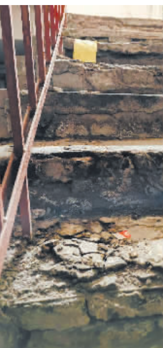
二楼的楼梯踏步,水泥层已粉化开裂。