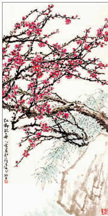
国画《红梅放春》 作者 陈茂樑