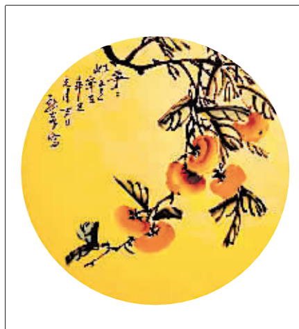
国画《事事如意》 作者 于祥云