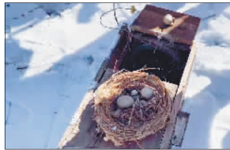
清理出未孵化成功的鸳鸯蛋。

今年是野生鸳鸯落户兆麟公园第三十年,从最初的几只,到现在最多五六百只,野生鸳鸯们在绿化高度覆盖的城区和居民们和谐相处,始终受到市民的关注和保护,期待并欢迎它们重返冰城。