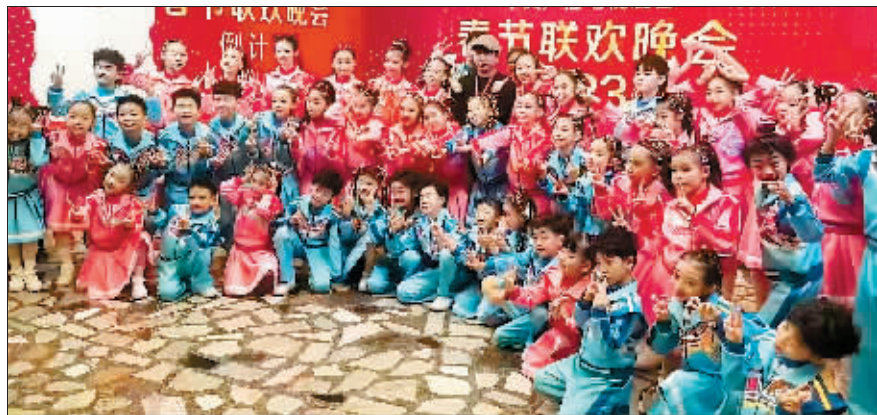
小演员们参加央视2023年少儿春晚。