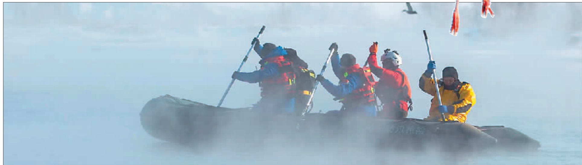
救援人员登岛喂鸟。