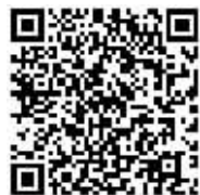
扫码看工程占道分布

施工路段道路变窄,通行效率降低,请过往车辆驾驶人保持平和心态,请按照各类交通标志、标线行车、停车,服从交通民警指挥,希望广大市民共同克服因道路施工造成的出行困难,共迎路畅民安的美好明天。